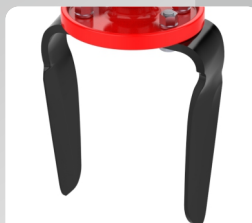
Premium Blades for Better Performance