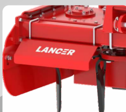
Front Safety/ CE Guards