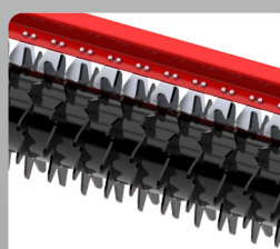
Optional Packer Roller