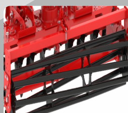
Optional Cage Roller