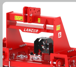
Rigid and Strong Front Support