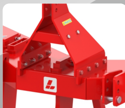
Rigid Box Frame