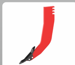
Easy Shank Height Adjustment