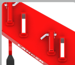
Easy Shank Width Adjustment