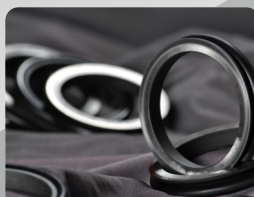
High Quality Mechanical Oil Seal