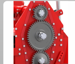
Heavy Duty Side Transmission Gear Drive