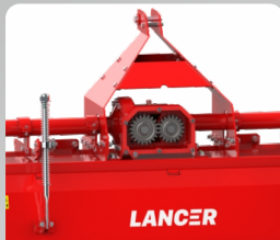
Heavy Duty Multi Speed Gear Drive with Additional Support