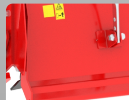
Additional Bend On Trailing Board