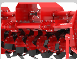
Helical Shape for Rotor Blades